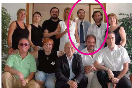
Collettivo che ha partecipato e sottoscritto l'accordo per la costituzione della futura federazione infermieristica e delle professioni sanitarie il 18 luglio 2005

Ci chiediamo quindi se il volantino qui sotto a lato, pubblicato a natale sul sito: www.infermeriaautonomi.blogspot.com , che spesso ospita il Nursind, non avesse per caso anche qualche velato riferimento alla questione